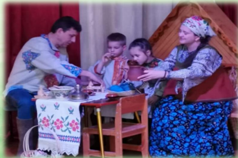
Роль «Жена бедняка»