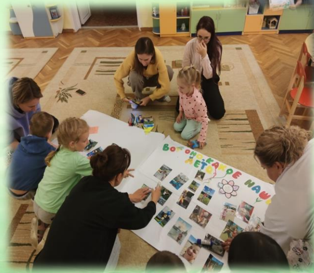
Совместное изготовление стенгазеты