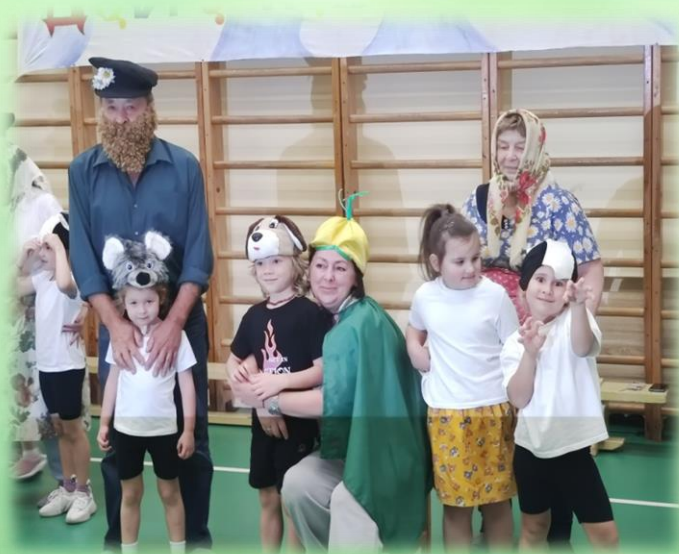
Спортивное развлечение ко Дню Пожилого человека