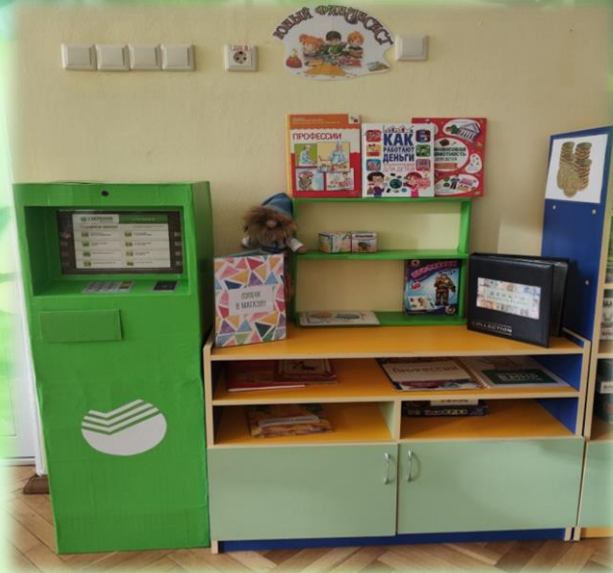
«Уголок «Юный финансист»