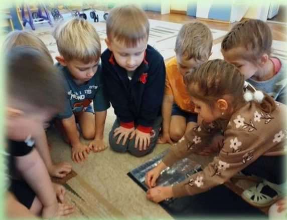
«Знакомимся с деньгами разных стран»