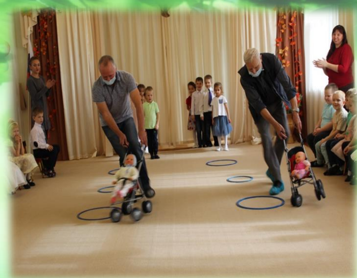
Квест «Ладушки-ладушки, дедушки и бабушки»