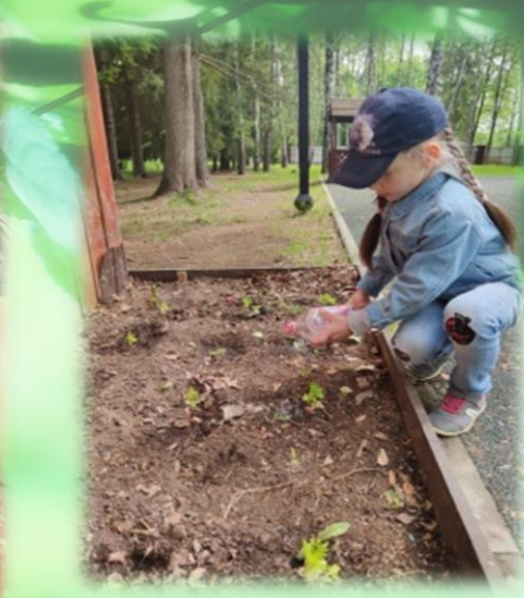
Собираем семена, выращиваем рассаду и украшаем клумбы