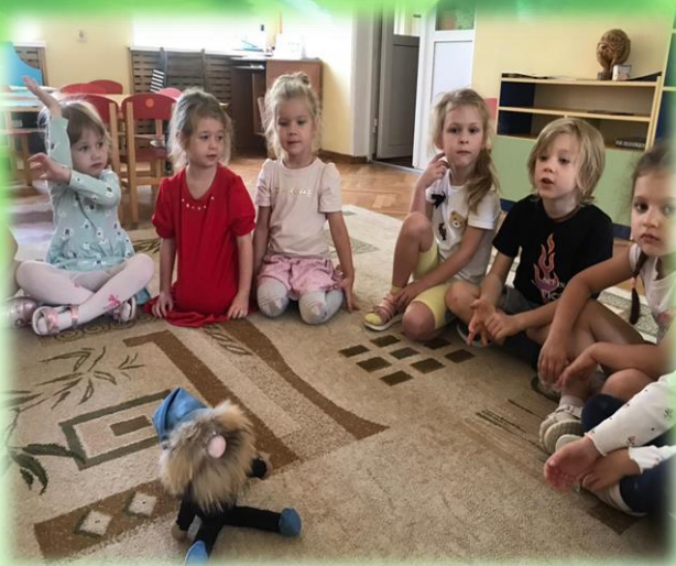
«Знакомство с Гномом-Экономом»