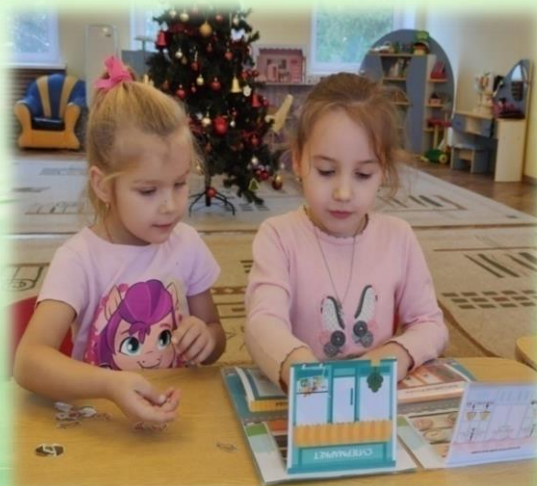
«Лепбуки «История денег»