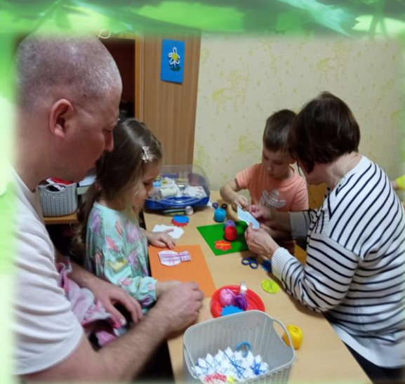
Посещение мастер-класса «Мама лисица и ее лисенок»